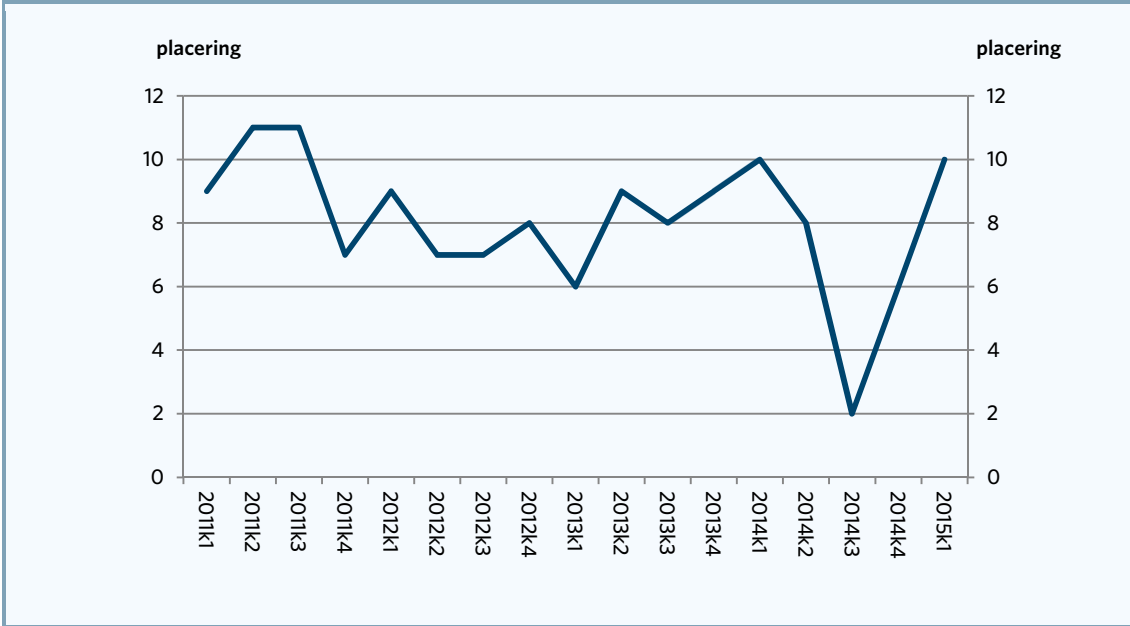
Figur 1. Danmarks relative placering i EU, antal asylansøgninger pr. 1000 indbyggere