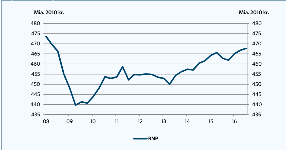
Figur 2. Udviklingen i BNP

Anm: Data er korrigeret for sæsonudsving.