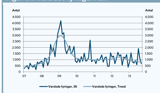
Figur 1A. Varslede fyringer I alt

Anm.: Data er sæsonkorrigeret