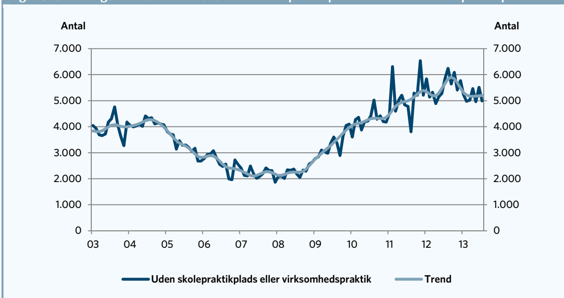
Figur 3. Udviklingen i antallet af elever uden skolepraktikplads eller virksomhedspraktikplads

Anm.: Der ses på elever som hverken har en skolepraktikplads eller en virksomhedspraktikplads. Data er sæsonkorrigeret. Statistikken blev omlagt i januar 2013, men iflg. UVM, kan data godt anvendes tilbage i tid.