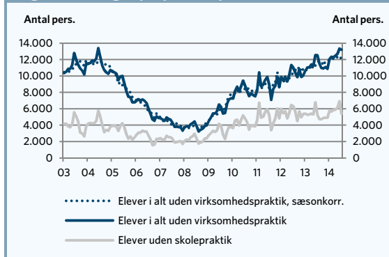
Figur 1. Mangel på praktikpladser

Samme dystre billede af praktikpladssituationen tegnes, når man ser på antallet af nye aftaler, der er blevet indgået mellem en elev og en virksomhed inden for det seneste år, jf. figur 2. Antallet af nye aftaler om praktik er faldet med 4,5 procent fra juli 2013 til juli 2014.