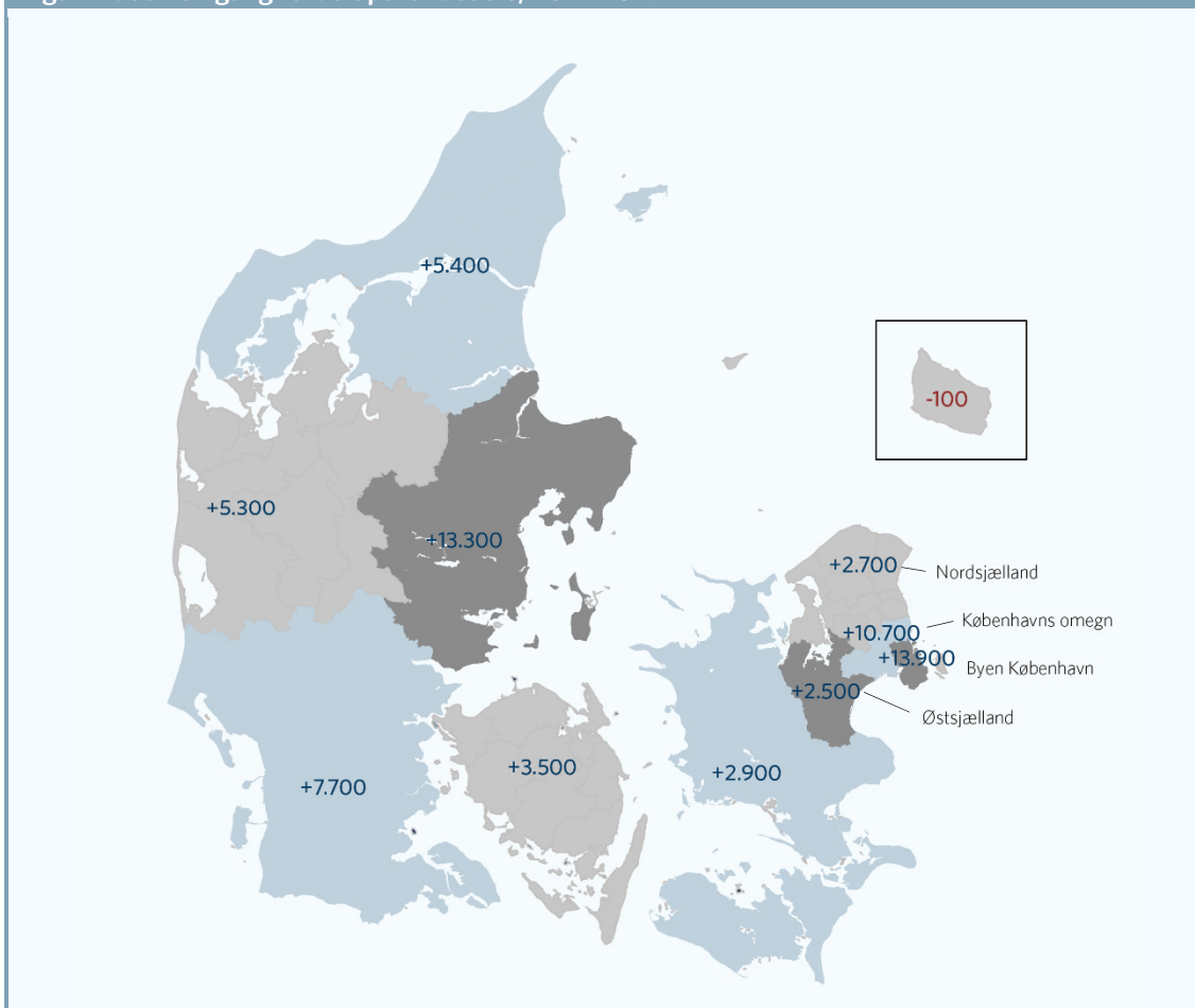
Figur 2. Jobfremgang fordelt på landsdele, 2017-2019

Kilde: AE på baggrund af Danmarks Statistik.