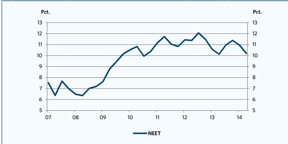
Figur 3. Andelen af unge mellem 15-29 år, som hverken er i arbejde eller i gang med en uddannelse

Fra 4. kvartal 2013 til 2. kvartal 2014 er andelen af unge, som hverken er i job eller i gang med en uddannelse, faldet fra 11,4 pct. til 10,2 pct. hvilket i antal svarer til ca. 11.500 personer.