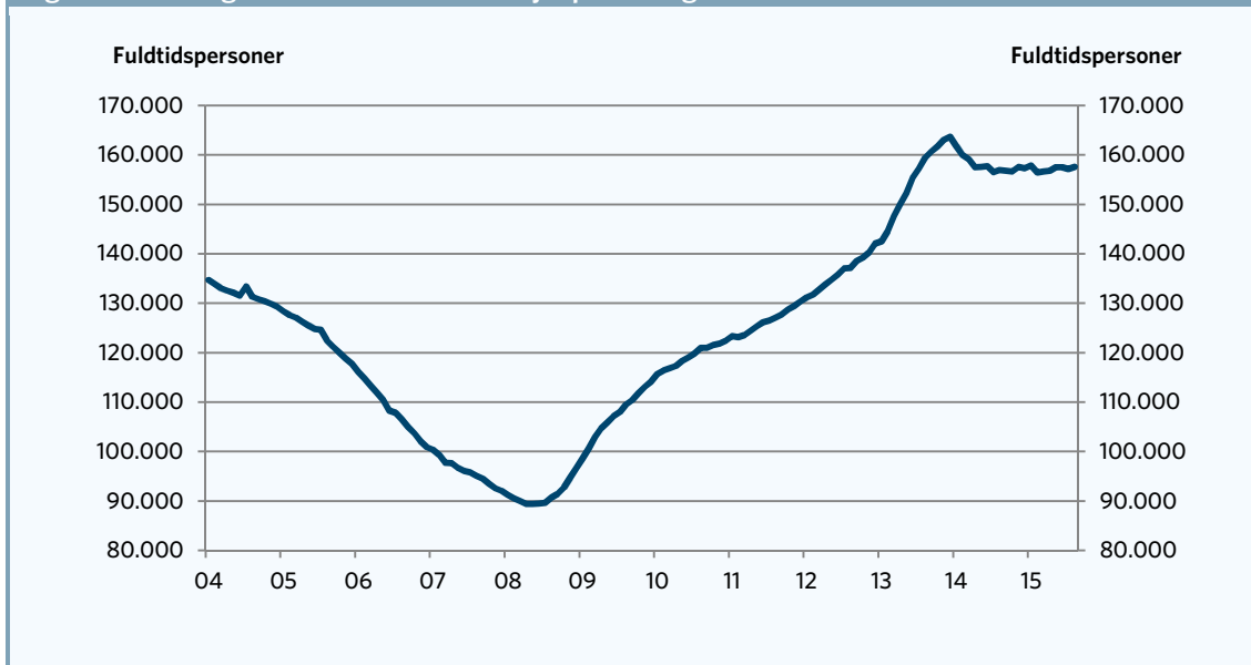
Figur 1. Udviklingen i antallet af kontanthjælpsmodtagere

Anm.: Data er sæsonkorrigeret. Akutledige på den særlige uddannelsesstøtte er inkluderet i tallene, hvorfor gruppen af arbejdsmarkedsparate kontanthjælpsmodtagere er vokset kraftigt siden årsskiftet.