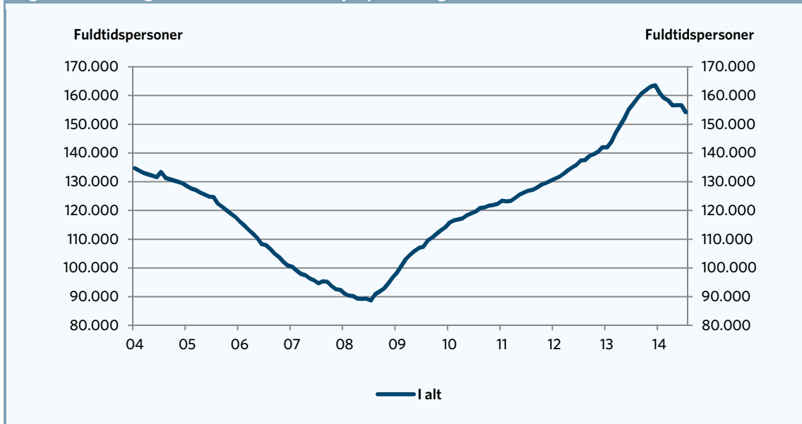
Figur 2. Udviklingen i antallet af kontanthjælpsmodtagere

Anm.: Data er sæsonkorrigeret. Der ses på månedsdata.