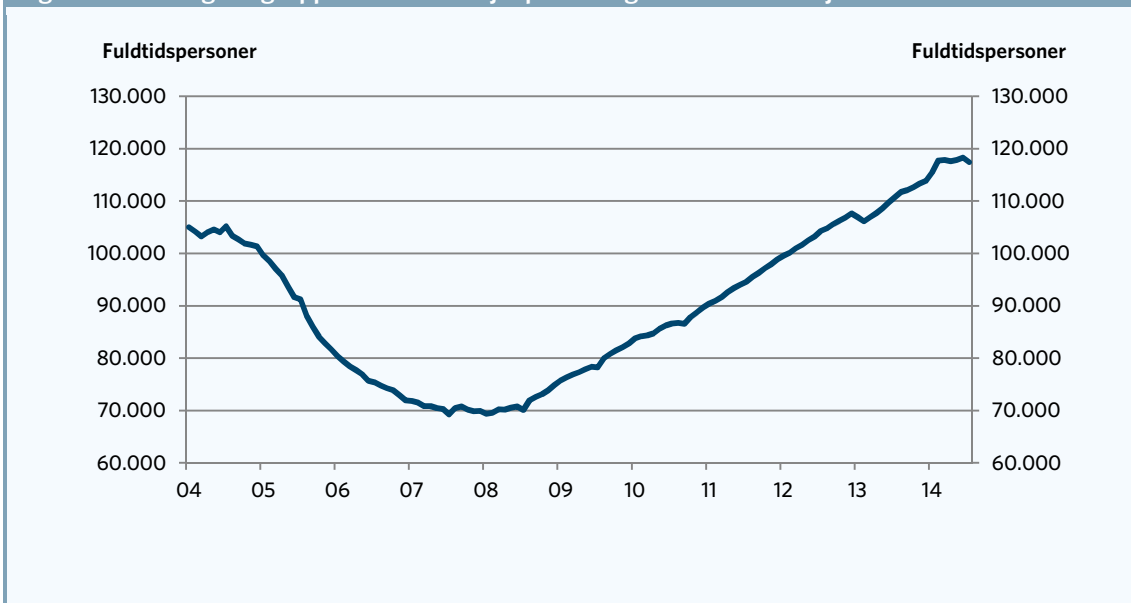
Figur 3. Udviklingen i gruppen af kontanthjælpsmodtagere udenfor arbejdsmarkedet

Anm.: Data er sæsonkorrigeret. Der ses på månedsdata. Kilde: AE på baggrund af Danmarks Statistik og Beskæftigelsesministeriet.