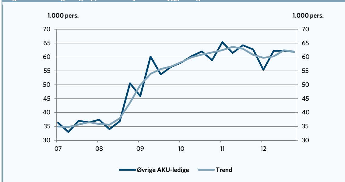
Figur 1. Udviklingen i gruppen af arbejdsløse skyggeledige

I 4. kvartal 2012 udgjorde gruppen af skyggeledige, som ønsker et job, søger aktivt efter et job og kan tiltræde et job indenfor 14 dage ca. 62.000 personer (sæsonkorrigeret) og i løbet af krisen er gruppen vokset med ca. 28.000 personer. Det fremgår af figur 1.