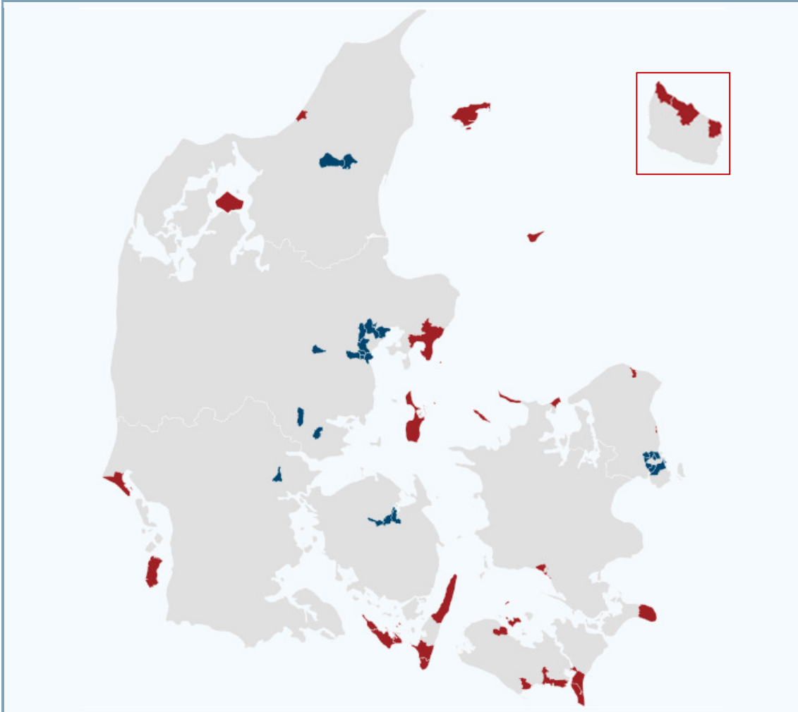
Figur 2. Danmarks 30 ældste og 30 yngste postnumre

Anm: Befolkning pr. 1.januar året. I København og Frederiksberg er postnumrene grupperet på de to første cifre. Fx er alle med postnumre i intervallet 1100-1199 grupperet til postnummer 1100 osv.